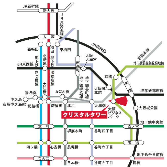
■大阪市内中心部路線図