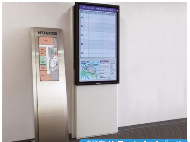
会議室インフォメーションボード