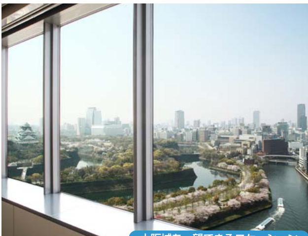
大阪城を一望できるロケーション