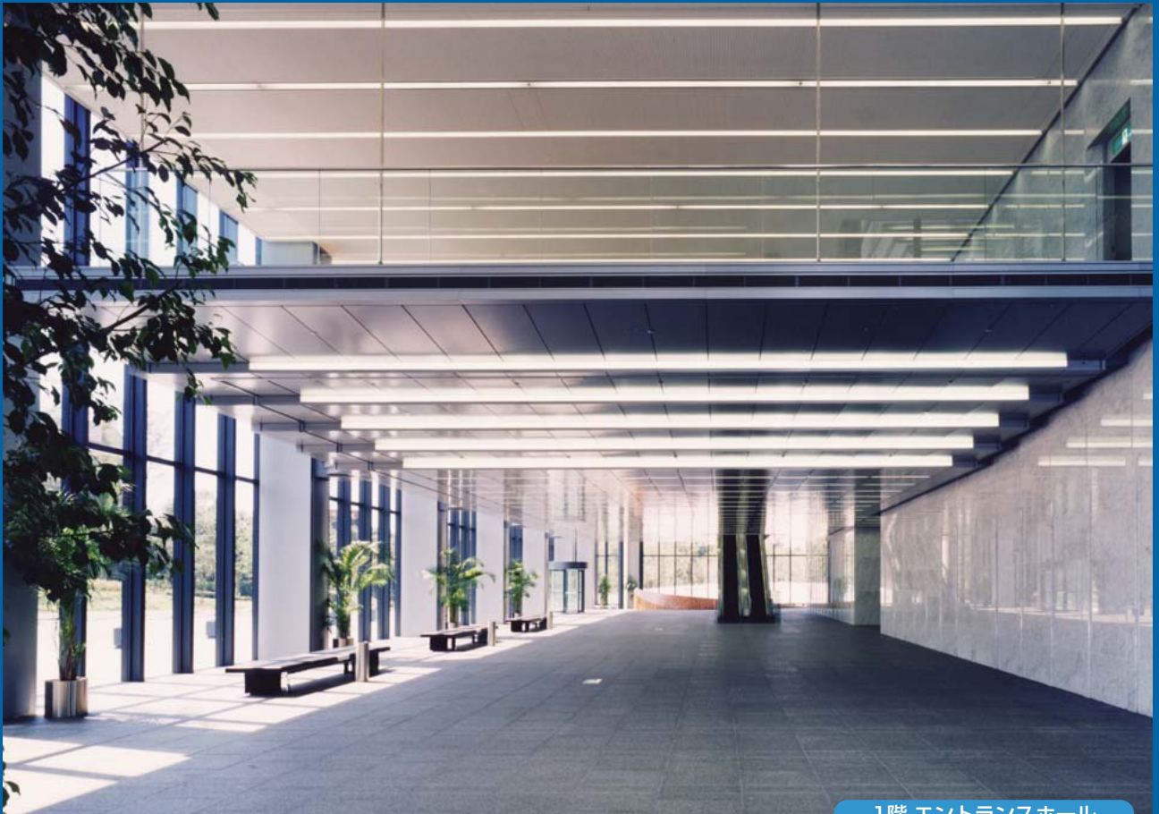
1階 エントランスホール